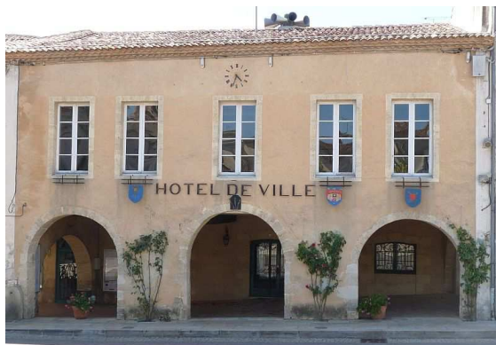
Sauveterre de Guyenne

Eine Delegation aus der Samtgemeinde Sottrum wird im Rahmen der Partnerschaft Sauveterre besuchen. Die Fahrt erfolgt in einem modernen Reisebus auf der Hinfahrt mit einer Übernachtung in Orleans an der Loire. In Sauveterre erwartet uns ein umfangreiches Besuchsprogramm, zu Anfang mit dem traditionellen Weinfest. Die Rückfahrt erfolgt am 2. August mit einer Übernachtung in Paris, so dass die Delegation am 3. August abends wieder in Sottrum eintrifft.