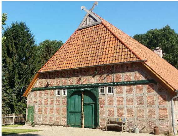
Thölkes Hus in Höperhöfen

Zu diesem Gottesdienst, der um 11:00 Uhr beginnt, sind Gäste sehr herzlich eingeladen.