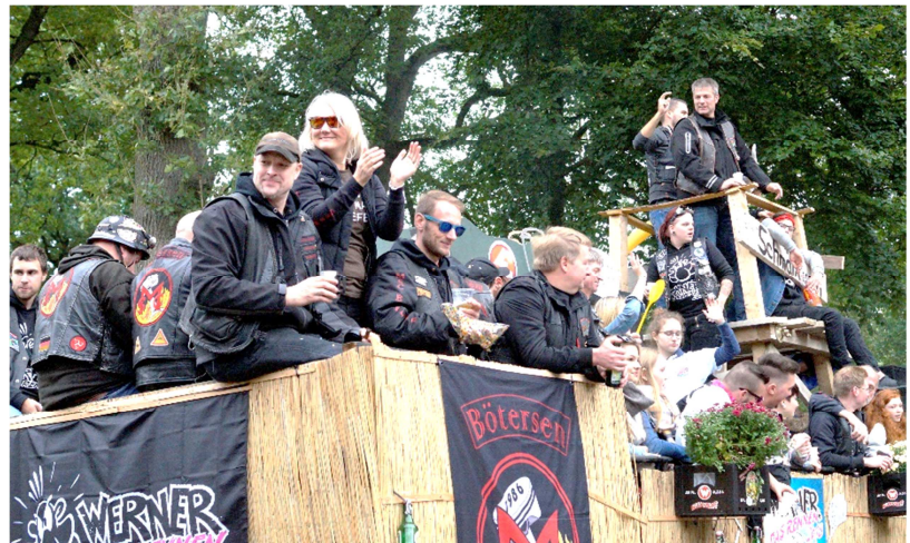
2. Preis für den Motorradclub