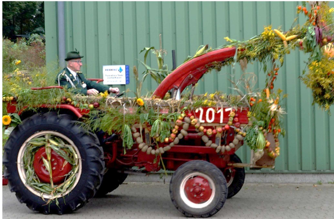
Sonderpreis für Klaus Trefke