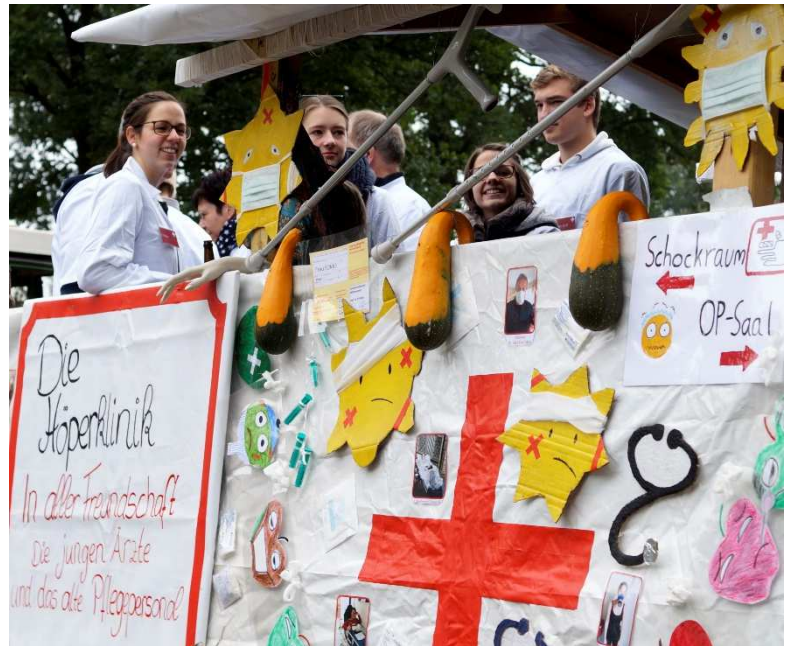
1. Preis für die Höperklinik