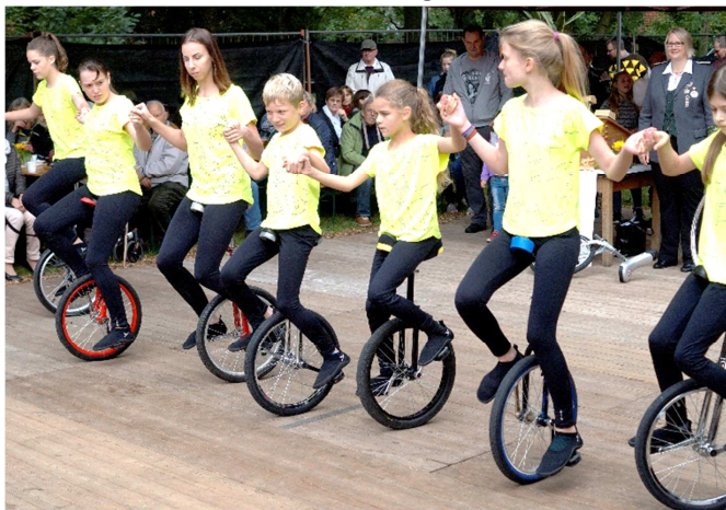
Die Einrad Mädels aus Waffensen