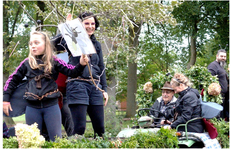
3. Preis für die Glühwürmchen