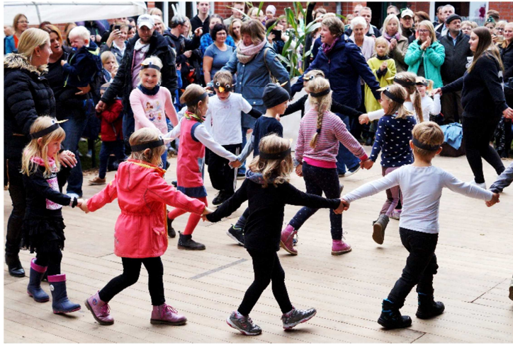
Die Kleinsten vom Kindergarten