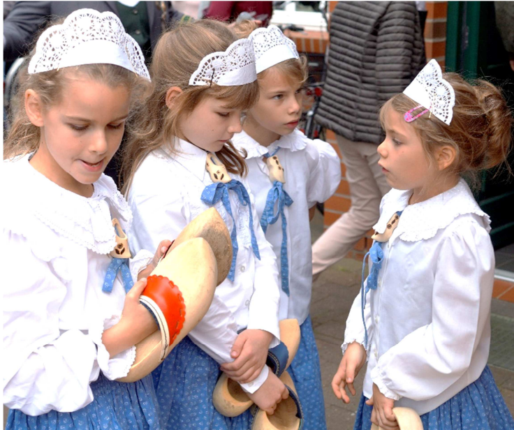
Die „Spinnstuv“ Tänzerinnen