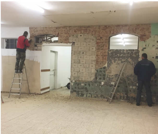
Altes Gemäuer wurde zu neuem Glanz verholfen

Und wo man schon mal dabei war, wurde zu guter Letzt auch noch die Holzkonstruktion an der Decke abgebaut.