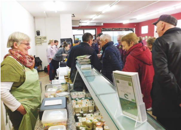
Regionale Produkte von lokalen Produzenten konnten probiert werden

ren oder Honig, die von den lokalen Produzenten ausgestellt wurden und vor Ort auch probiert werden konnten. Regionalität und lokale Produkte sind bei vergleichbaren Dorfläden zu einem wichtigen Faktor im Warensortiment geworden.