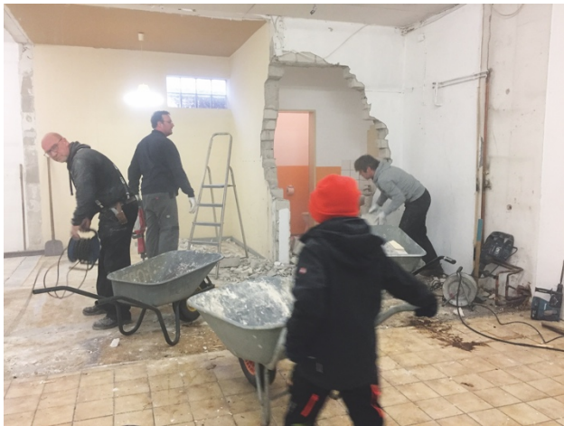
Abbrucharbeiten in den hinteren Verkaufsräumen

Darauf hatte der Arbeitskreis Dorfladen schon lange gewartet und kurz vor Weihnachten war es endlich soweit: die lang ersehnte Nachricht kam über die WhatsApp Gruppe reingeflogen, dass der erste Arbeitsdienst am 29. Dezember 2018 stattfindet.