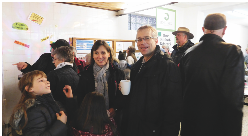
Interessierte erhielten Einblick in die aktuellen Planungen

freute sich Brunckhorst. Die Türen seien förmlich aufgesprungen und der Besucherstrom ebte bis zum Schluss um 18 Uhr nicht ab.