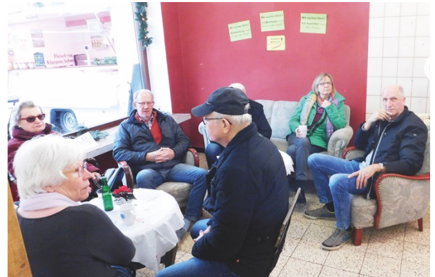
Gemütliche Atmosphäre im zukünftigen Café-Bereich

Insgesamt ergab sich ein Ambiente, das sich schon beinahe wie ein richtiger Dorfladen anfühlte.