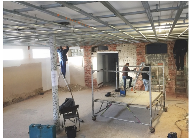
Die Unterkonstruktion für die F30 Decke ist schon montiert

Aktuell plant der Beirat, wie die Verkaufsfläche in beiden Räumen sinnvoll genutzt werden kann, sowie auch die Sozialräume, Personal-WC und ein barrierefreies Kunden-WC im hinteren Bereich untergebracht werden können.