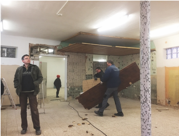
40-jährige Holzkonstruktion weicht neuen Gestaltungsideen

Und wo man schon mal dabei war, wurde zu guter Letzt auch noch die Holzkonstruktion an der Decke abgebaut.