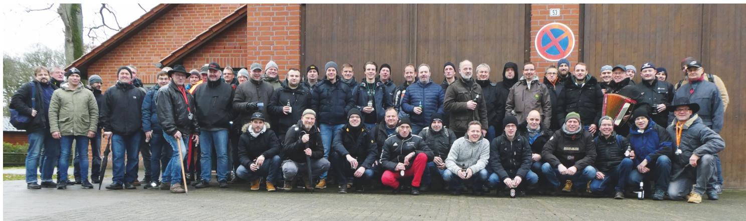
Eiersuchen der Männer am 12.01.2019