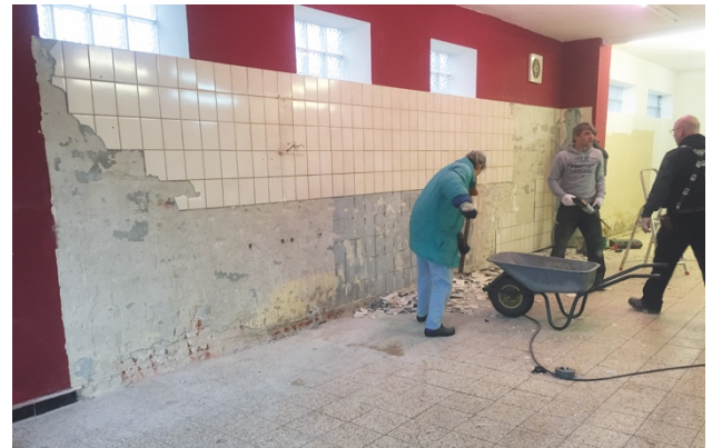
Fliesenspiegel hinter dem ehemaligen Verkaufstresen wurde entfernt

zukünftigen Raumgestaltung unabhängig zu sein, hatte sich der Beirat zu diesem Schritt entschieden. Jeder aus dem Arbeitskreis hatte dementsprechend Werkzeug mitgebracht, u. a. Brecheisen, Schaufel, Schubkarre, Trittleiter und Vorschlaghammer. Es wurde kräftig angepackt, umgestoßen und aufgestemmt und die über 20 ehrenamtlichen Helfer hatten sichtlich Spaß an der teils sehr lauten und staubigen Arbeit.